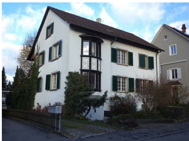
Zweifamilienhaus in Binningen, Verkaufspreis: über CHF 1'500'000.— Verkauf 2014