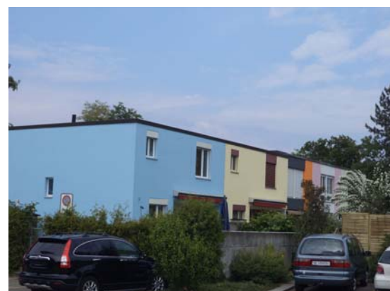
Überbauung Kleestrasse Reinach, vor und nach Parzellierung und Renovationen durch die neuen Eigentümer Verkaufspreise: ca. CHF 470'000–620'000

Diskretion beim Immobilienverkauf ist unser gemeinsamer Schlüssel zum Erfolg!