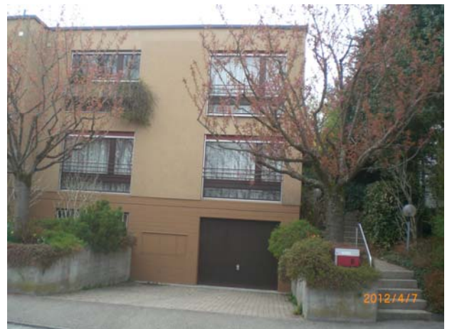
5 1/2-Zimmer-Eckeinfamilienhaus in Binningen Verkaufspreis: über CHF 1'100'000.— Verkauf 2012