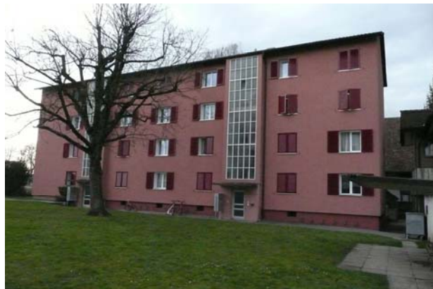
Mehrfamilienhaus in Alchenflüh Verkaufspreis: über CHF 2'600'000.— Verkauf 2013