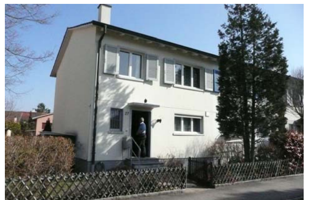
4 1/2-Zimmer-Eck-Einfamilienhaus in Reinach, Verkaufspreis: knapp CHF 600'000.— Verkauf 2012