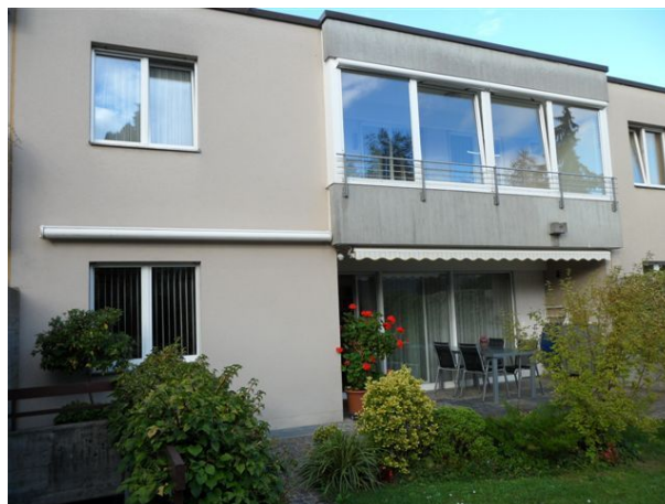
Reihen-Einfamilienhaus in Reinach Verkaufspreis: über CHF 850'000.— Verkauf 2011