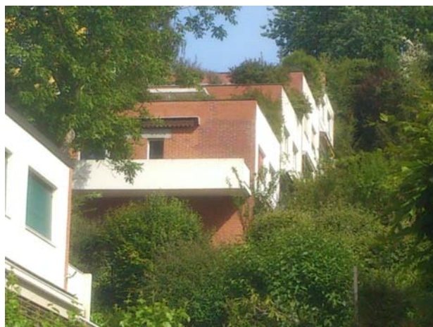
4 1/2-Zimmer-Terrassenhaus in Binningen Verkaufspreis: über CHF 800'000.— Verkauf 2013