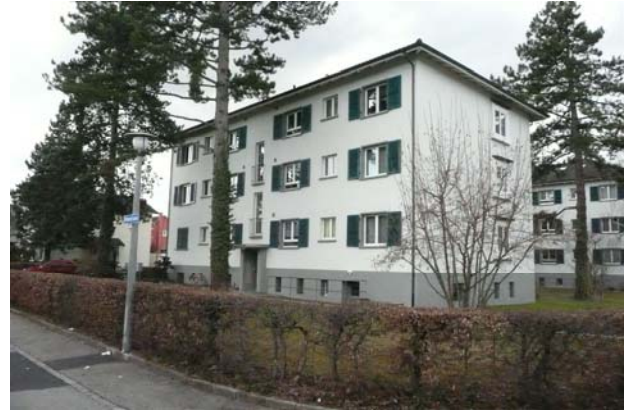
4-Zimmer-Wohnung in Münchenstein Verkaufspreis: über CHF 400'000.— Verkauf 2012