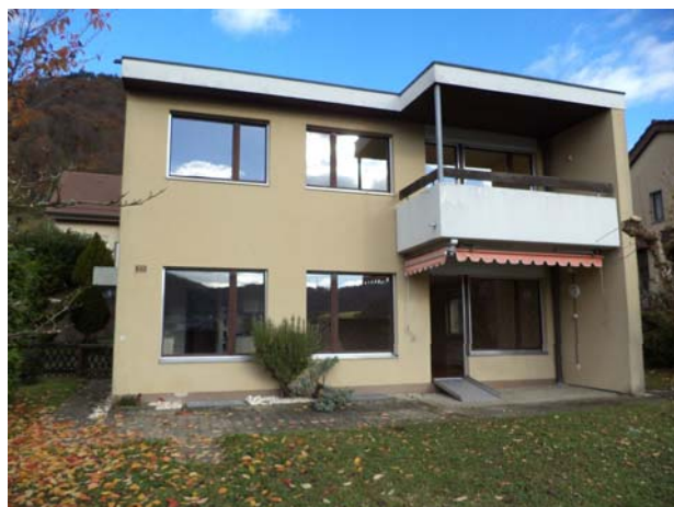
Freistehendes 5 1/2-Zimmer-Einfamilienhaus in Lausen, Verkaufspreis: ca. CHF 750'000.— Verkauf 2014