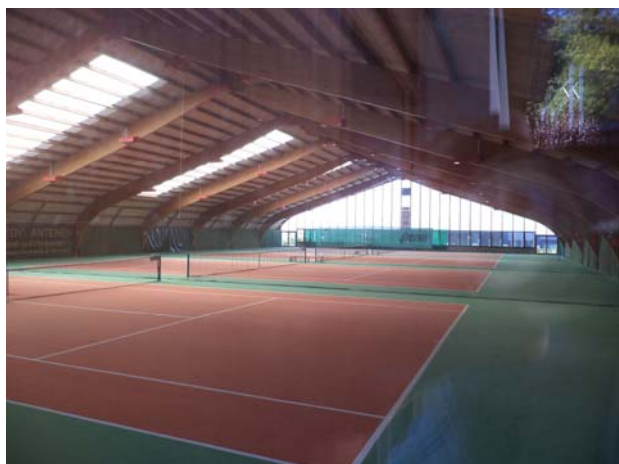
Bauland mit Tennishalle in Arlesheim, Verkaufspreis: über CHF 4'000'000.— Verkauf 2014