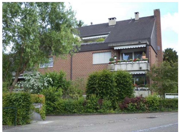
4 1/2-Zimmer-Eigentumswohnung in Arlesheim Verkaufspreis: knapp CHF 500'000.— Verkauf 2011