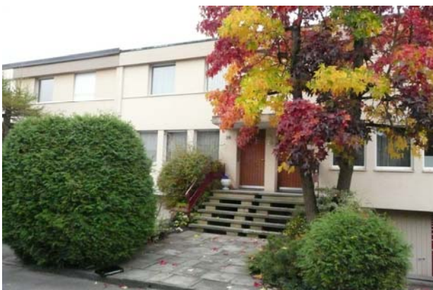
5 1/2-Zimmer-Einbau-Einfamilienhaus in Reinach Verkaufspreis: über CHF 600'000.— Verkauf 2012