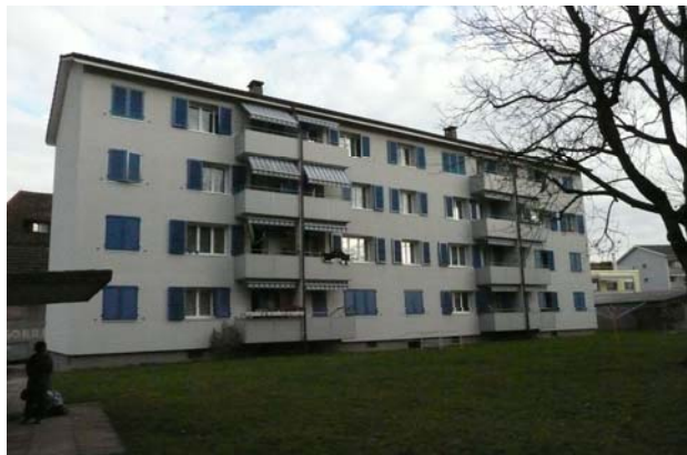
Mehrfamilienhaus in Alchenflüh Verkaufspreis: ca. CHF 2'500'000.— Verkauf 2012