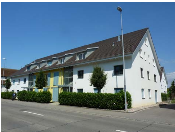
5-Zimmer-Wohnung in Pratteln Verkaufspreis: knapp CHF 700'000.— Verkauf 2012