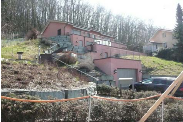
5 1/2-Zimmer-Villa in Dornach Verkaufspreis: über CHF 2'600'000.— Verkauf 2012