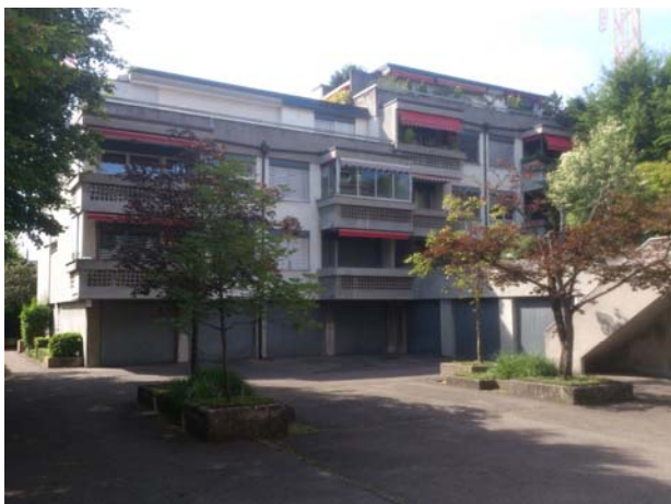
2 1/2 - Zimmer-Eigentumswohnung in Therwil Verkaufspreis: über CHF 200'000.— Verkauf 2011