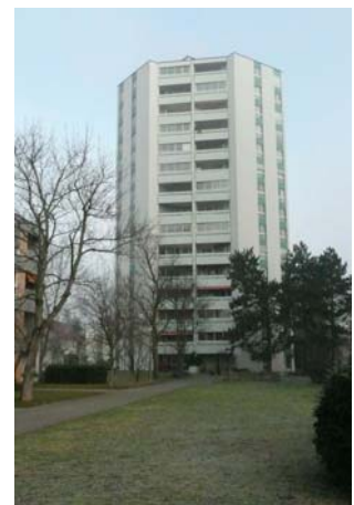
4 1/2-Zimmer-Eigentumswohnung in Reinach Verkaufspreis: ca. CHF 550'000.— Verkauf 2012